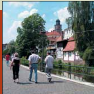
Über die Lauter führen Schrittsteine zur sehenswerten Fachwerkstraße Am Graben.