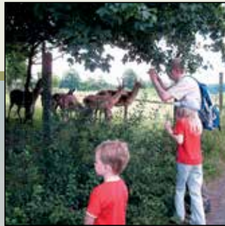
Das nahe gelegene Wildgehege ist ein Höhepunkt bei Wanderungen.