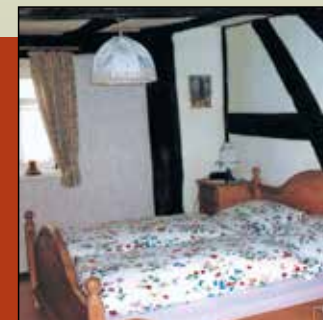
Romantisch träumt sich's im rund 300 Jahre alten Fachwerkhäus.

Nicht nur bei schlechtem Wetter ist der Gemeinschaftsraum ein idealer Treffpunkt für Groß und Klein. Gruppen können hier gemeinsam kochen, essen und gesellig zusammensitzen.