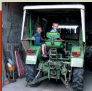
Klettern dürfen die Kleinen auf den Traktor, aber Fahren ist nur den Großen erlaubt.