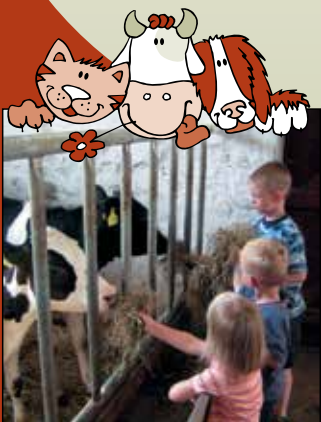
Die Kälbchen lassen sich gerne mit duftendem Heu füttern.