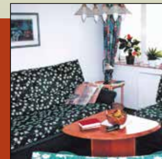
Wohlfühlen und entspannen können Sie sich in den komfortablen Ferienwohnungen.

Brötchenservice auf Wunsch ist für uns genauso selbstverständlich wie die Gästeabholung vom Bahnhof und Frühstück für Kurzurlauber.