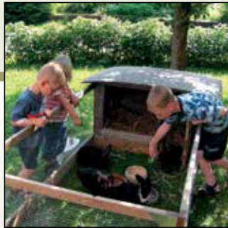
Die Hasenbande auf Sommerfrische erfreut sich vieler Besucher.