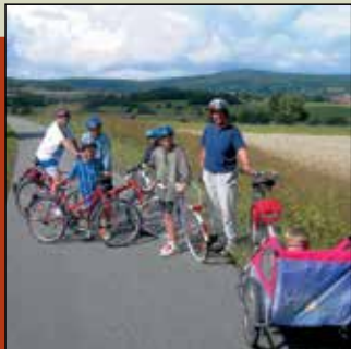
Der 74 km lange Vulkanradweg ist auf einer ehemaligen Bahntrasse angelegt.

In der benachbarten Kreisstadt Lauterbach gibt es zahlreiche Möglichkeiten, die regionale Küche zu genießen, bei jedem Wetter das Spaßbad zu besuchen, Kulturhistorisches zu betrachten oder einfach idyllische Fachwerk-gässchen entlang zu flanieren.