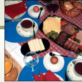
Ein Lauterbacher Sprichwort besagt: „Gut gefriesteckt spielt mer de ganze Doach...“

Beim ersten „Muh“ aus dem Stall können Sie schon dabei sein: wenn die Kühe gefüttert und gemolken werden, das kleine Kätzchen nach den ersten Streicheleinheiten sucht, der Hofhund schwanzwedelnd nach dem Rechten sieht und ein ganz normaler Tag bei uns beginnt.