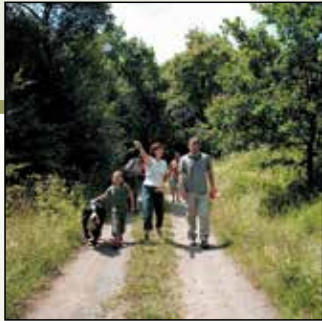
Nicht nur der Vulkanring Vogelsberg bietet Erlebnisqualität beim Wandern.