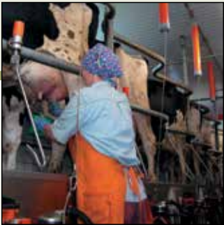
Im Melkstand kann jeder zuschauen, wie die Milch aus dem Euter kommt.