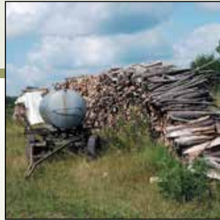
Rechts und links vom Wegesrand zeigt sich die Urtümlichkeit des Vogelsbergs.

... eine urwüchsige Mittelgebirgslandschaft zum Durchatmen, Wandern und Radeln! Die Vogelsberger Höhen und Weiten bringen Drahtesel und Schusters Rappen zu Höchstleistungen: Nach einem reichhaltigen Frühstück, ausgerüstet mit ordentlich Wegzehr und (Rad-)Wanderkarte können Sie mit dem Rad, Inlinern, Rollski oder zu Fuß rechts und links des Vulkanradweges Ausblicke auf den Naturpark Vogelsberg genießen.