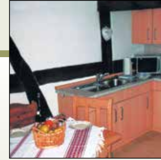
Moderne Gemütlichkeit und altes Gebälk geben dem Urlaubsgefühl ein Zuhause.